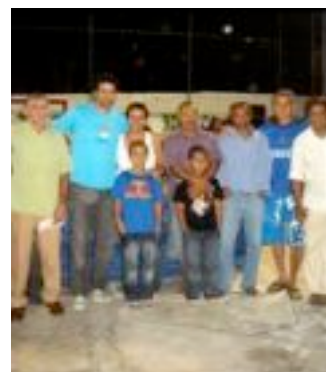
Raï et la communauté après l'inauguration