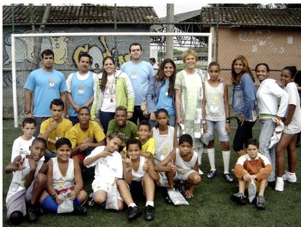
Avec l'équipe des animateurs sociaux et sportifs et un groupe de jeunes de la Favela du Caju (Rio de Janeiro)