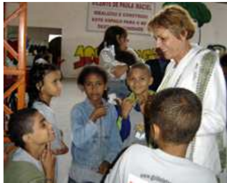
Dans le centre communautaire de Jacaré - Niteroi