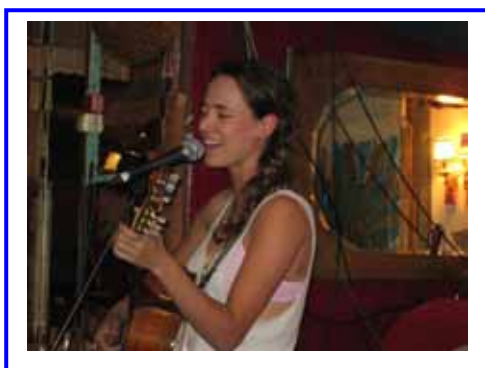
La chanteuse Tiê