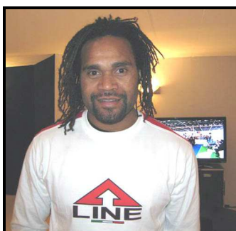
Karembou a aussi été invité au Trophée Gol de Letra