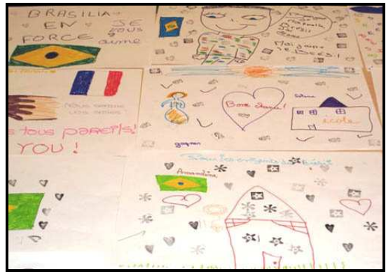
Les enfants étaient accueillis pour réaliser des dessins qui furent envoyés au Brésil