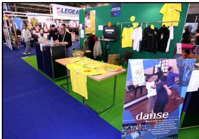
Le stand Gol de Letra tenu par les bénévoles pendant trois jours