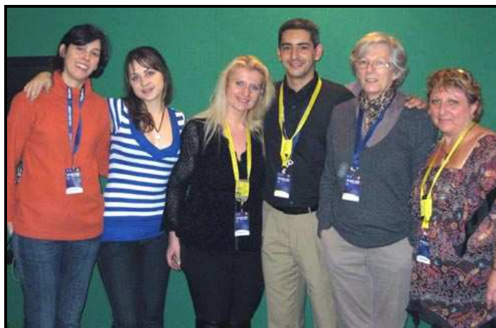
Les membres de Gol de Letra France