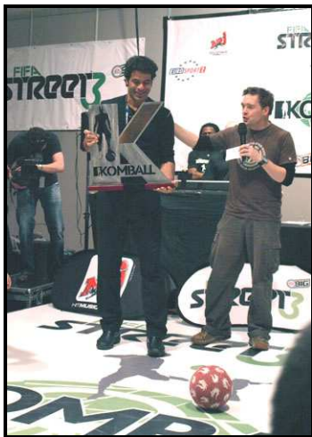
Rai a fait partie du jury d'un challenge de foot freestyle organisé par Komball