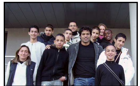
Raï et le groupe qui va au Brésil

Le 5 mars dernier, Raï s'est rendu à Lyon, à la rencontre du groupe de jeunes français de Sport dans la Ville qui partira du 13 au 25 avril au Brésil. L'occasion de leur parler de Gol de Letra, des difficultés que les jeunes Brésiliens rencontrent mais aussi du formidable espoir que représentent pour eux les projets de formation de la Fondation.