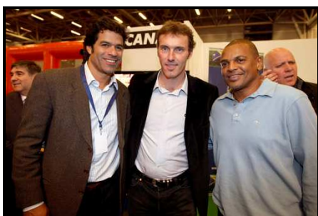
Raï, Laurent Blanc et Bernard Lama