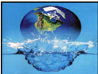
Projet « Porteurs d'eau »

Les 30 jeunes qui font partie du projet se réunissent chaque semaine pour évaluer les politiques publiques et rechercher de nouvelles pratiques de sensibilisation à l'environnement et sa préservation. Parmi les nombreuses activités éducatives, on peut mentionner : la création, par les jeunes, d'un site Internet faisant état de l'évolution du projet ; la rédaction de fiches action autour de questions environnementales ; des ateliers sur la récupération et recyclage de matériaux.