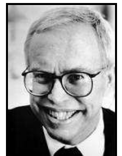
James Heckman Lauréat du Prix Nobel d'économie en 2000.

« Il est rare qu'une initiative de politique publique qui promeut l'équité et la justice sociale promeut en même temps, la productivité de l'économie et de la société dans son ensemble. C'est le cas d'une politique d'investissement dans les jeunes enfants défavorisés .»